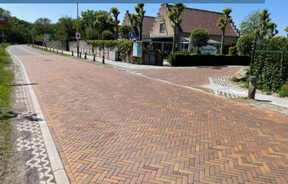
Situatie na de herinrichting

De Hoogenboomlaan vanaf Camping Schouwen tot en met het kruispunt Camping Julianahoeve is in de afgelopen maanden flink onder handen genomen. Zo heeft er een herinrichting van de rijbaan en het voetpad plaatsgevonden. Voor de veiligheid van de voetgangers is waar mogelijk gekozen voor een vrij liggend voetpad, bestaande uit betonplaten van twee meter breed. Waar de ruimte beperkt is, is het voetpad verhoogd aangebracht ten opzichte van de rijbaan en uitgevoerd in betonplaten van één meter breed. In de oude situatie nodigde de weg uit tot hard rijden, hiervoor zijn er snelheid remmende maatregelen getroffen, zoals het realiseren van "pleintjes" ( shared-space principe) en is er evenals in de voorgaande fase gekozen voor een "karrespoor" tussen beide rijbanen. Tenslotte is het project afgewerkt met nieuwe beplanting en bomen voor een betere klimaatbestendigheid en het tegengaan van hittestress.